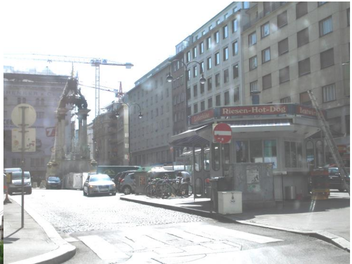
Wien, Hoher Markt